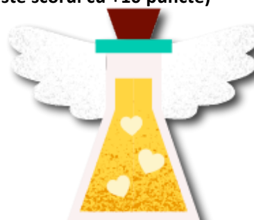
POTIUNEA MAGICA (mareste scorul cu +10 puncte)