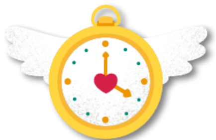
CEASUL LUI CUPIDON (mareste timpul de joc cu +3 secunde)