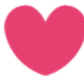
INIMA (simbol grafic pentru 1 punct)